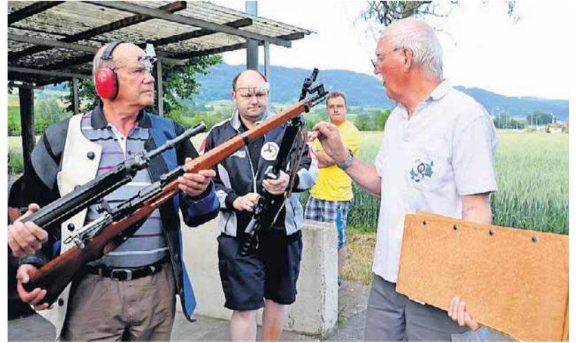
Laufkontrolle bei den Thaler Schützen in Aedermannsdorf