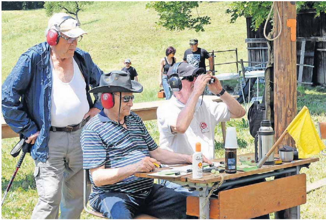
Das Feldschieszen, ein Treffpunkt der Generationen: Wie hier am Kontrolltisch auf der Froburg ...