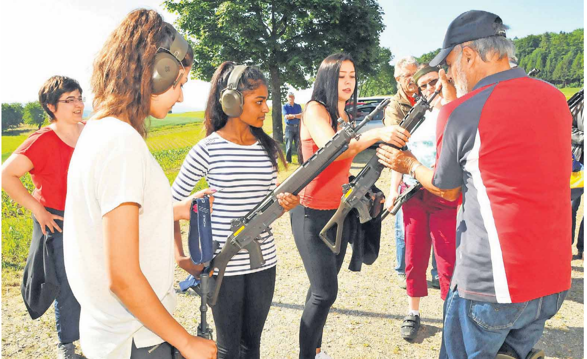
In Obererlinsbach stimmt die Frauenquote am Feldschiessen – dank dieser Gruppe Jungschützinnen aus Däniken.