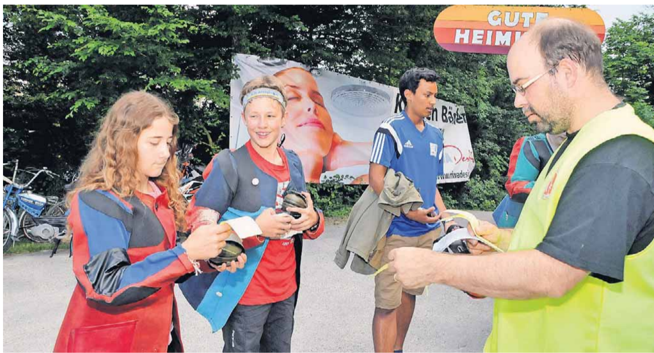
Nicht alle scheinen mit der Punkteausbeute in Oensingen gleichermassen zufrieden.