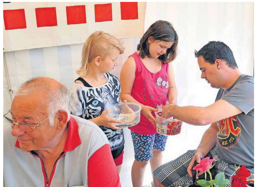
Darf auch am Feldschiessen nicht fehlen: Losverkauf in Wisen.

Feldschiessen OT-Fotograf Markus Müller hielt die besten Momente 2015 zwischen Obererlinsbach und Aedermannsdorf fest